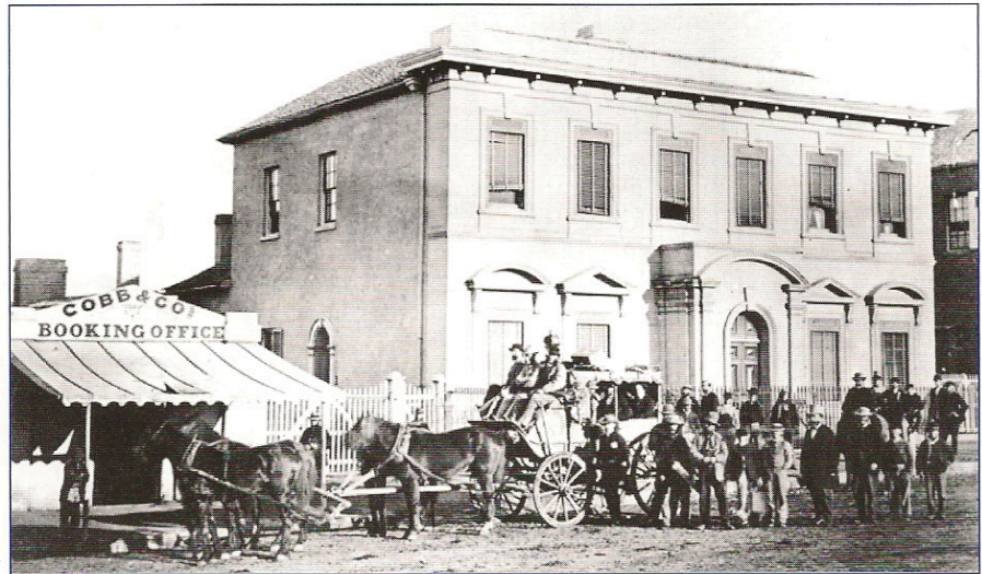
Australie, coach de 9 passagers.